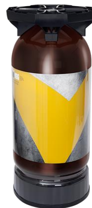
UniKeg® 20 L

Plongeur à tête standard : European Sankey, type S