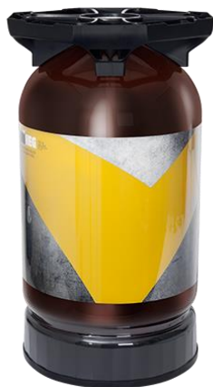
UniKeg® 30 L